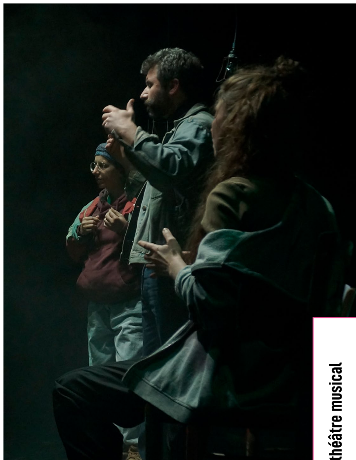
illustration et texte : Icinori, Mayumi Otero et Raphaël Urwiller adaptation et mise en scène : Eric Domenicone, Yseult Welschinger jeu et manipulations : Jeanne Marquis, Robin Spitz musique : Samuel Klein marionnettes et costumes : Yseult Welschinger dispositif scénique : Antonin Bouvret pop-up : Eric Domenicone animation vidéo : Marine Drouard mapping et régie générale : Maxime Scherrer